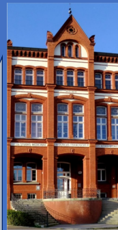
Universitätsmedizin Rostock rechtskräftige Teilkörperschaft der Universität Rostock Institut für Anatomie Gertrudenstr. 9 18057 Rostock

Am 22. Januar 2026 um 13 Uhr, können wir uns gemeinsam die Sammlung anschauen Ort: siehe Foto → Max. Personenanzahl: 25 Anmeldung durch Zahlung von 5 €/Mitglied